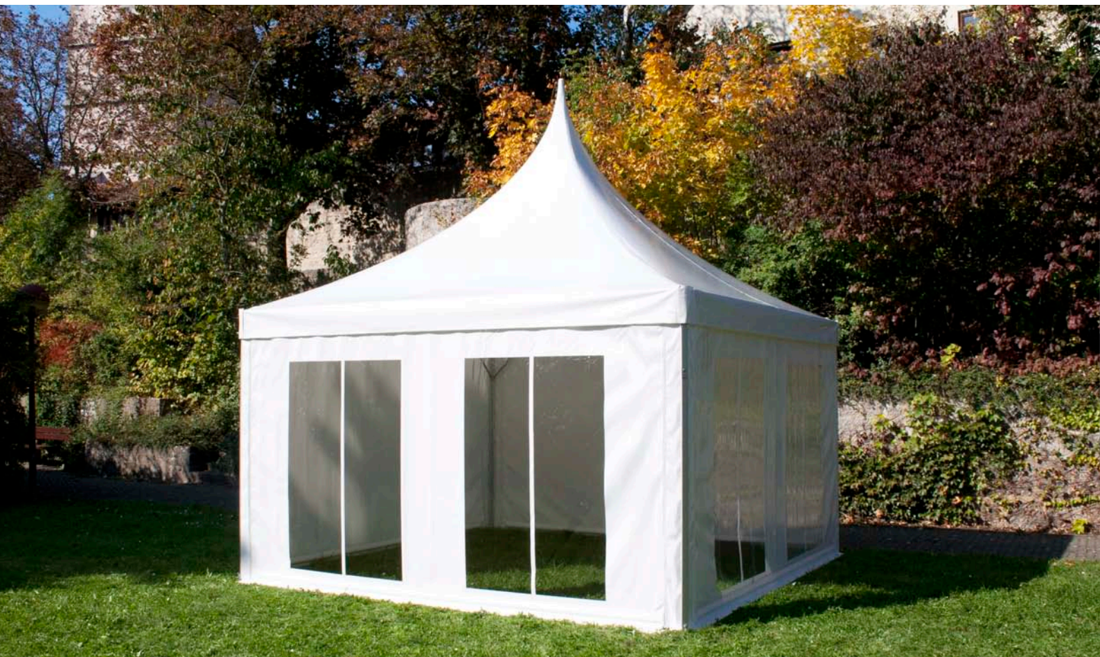
Abbildung enthält Sonderzubehör

Die Viereckpagode Vario zeichnet sich aus durch höchste Qualität bei maximaler Funktionalität und ansprechendem Design. Die leichte, dennoch sehr stabile Bauweise dank Zweinutkederprofil mit Vario-Nut, ermöglicht ein einfaches Handling. Die Viereckpagode Vario ist der ideale Einstieg in die Welt der professionellen Zelte.